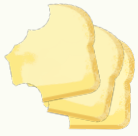
Céréales, grains, pains, pâtes, farine et sucre