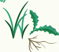
Feuilles mortes, gazon et autres herbes coupées, fleurs, petites branches, plantes d'intérieur et restants d'empotage