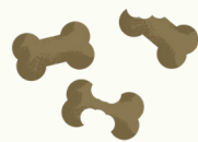
Nourriture pour animaux domestiques