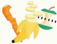
Fruits ou légumes cuisinés ou non