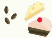
Produits laitiers, gâteaux, sucreries, noix, écailles